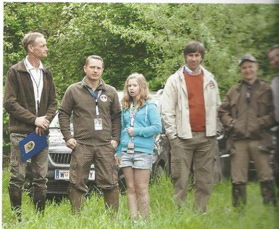
Mit und für Kinder zu arbeiten, wie hier beim Wolfgang-Diglas-Memorial Cup, macht den Funktionären doppelt so viel Spaß.