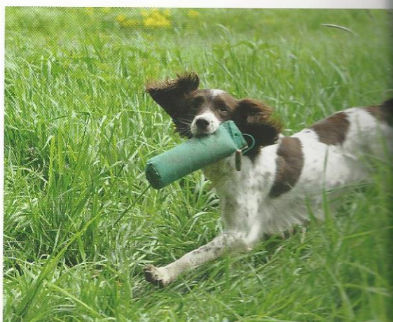
Ob Labrador oder Springer Spaniel – alle arbeiten hervorragend und verhelfen ihren Besitzern zu Erfolgen im Wolfgang Diglas Memorial Cup.